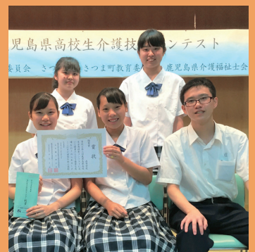
鹿児島県高校生介護技術コンテストで優秀賞を受賞しました。